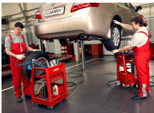
Специалисты по технической поддержке и эксплуатации автомобилей