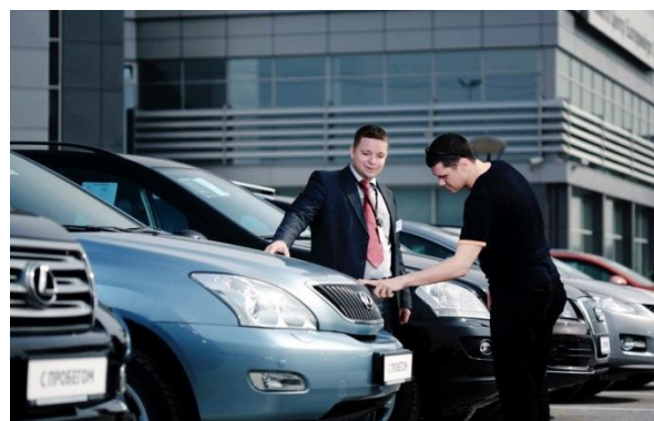
менеджеры сервисных предприятий по обслуживанию, ремонту и продажам автомобилей