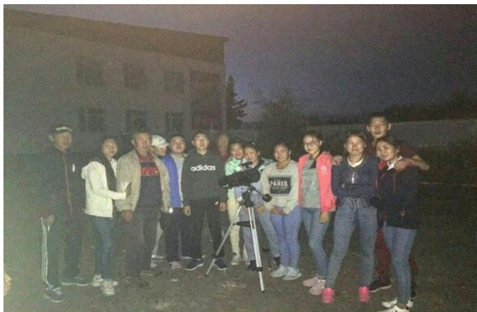
Студенты ТувГУ на практике